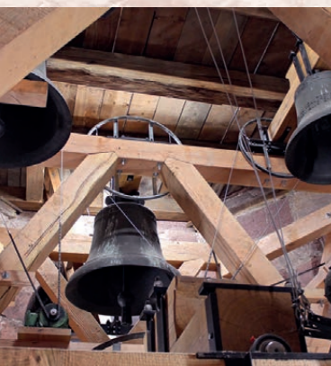
Glockenstuhl aus Holz