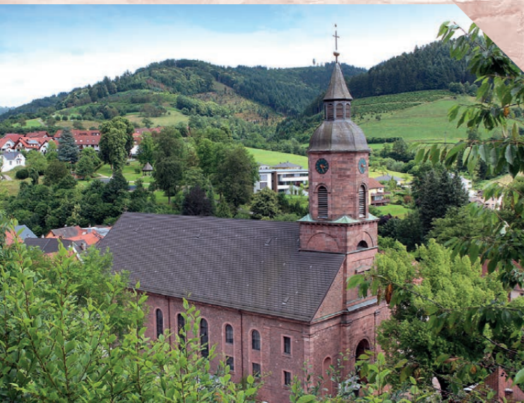
Erneuerung der Dachdeckung