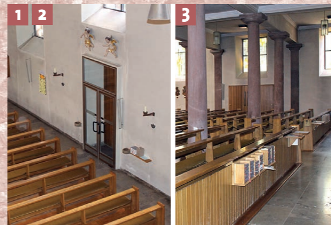
Heutiger Zustand vor der Innenrenovation

Durch den Anschluss an das Fernwärmenetz werden jährlich rund 18 Tonnen CO 2 -Emissionen eingespart.