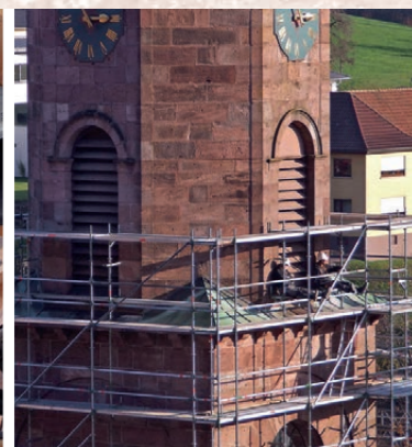
Reparatur Chor- und Turmdach, sowie der Außenfassade

Viele Privatpersonen, Handwerksbetriebe, Vereine und Firmen haben die Renovation mit einer Spende unterstützt.